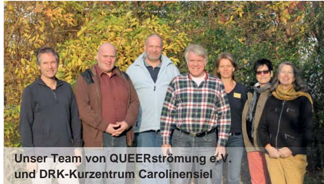
Unser Team von QUEERströmung e.V. und DRK-Kurzentrums Carolinensiel

Kinder zusätzlich: schwere geistige Behinderung, Bulimie.